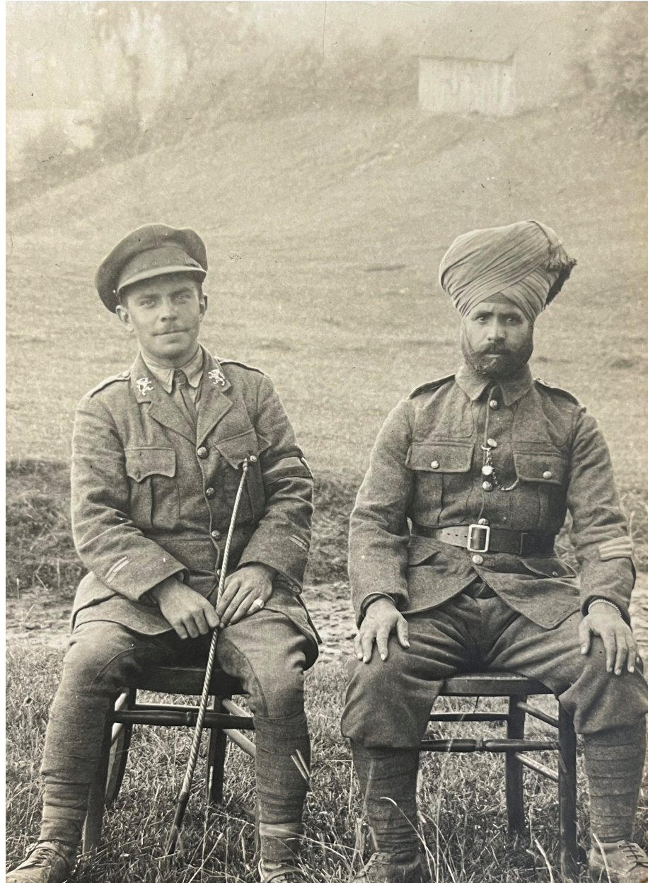
Een sikh- en een Belgische soldaat bij een ziekenhuis in Londen tijdens de Eerste Wereldoorlog. [Archief Belgische Evangelische Zending: 1091]

den Indische soldaten – en dus ook de sikhs – nog slechts zelden ingezet in België en raakte hun rol tijdens de Grote Oorlog grotendeels in de vergetelheid. Tegenwoordig staat er wel een monument voor de Indische troepen nabij het voormalige slagveld in Hollebeke. De sikhgemeenschap komt er elk jaar op Wapenstilstandsdag samen. Je kan de namen van vermiste sikhsoldaten ook terugvinden op de Menenpoort in Ieper.